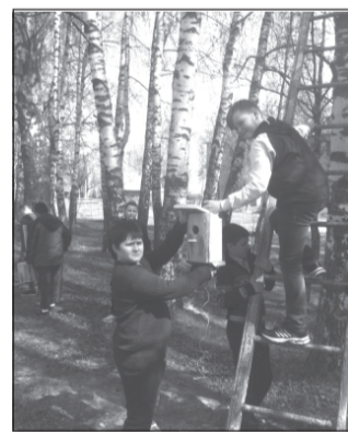
готовления домиков для птиц.