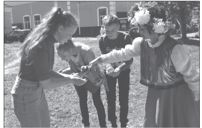
Умыться ключевой водой - весь год не болеть.

«Фишкой» же всего музейного действия стала... пуговица. И не простая, а пуговица желаний. Откуда такая идея и для чего она? У любого мероприятия должна быть изюминка, считает художник ГДК Ю. Жукова, автор данного креатива, а пуговица так многозначна и символична, что может стать центральной фигурой во многих интересных начинаниях, со временем имеющих перспективы превратиться в традицию. Пуговицы, как люди — они такие разные, и по размеру, и по цвету, и по форме крепления к ткани, с ними связано немало примет и поговорок в