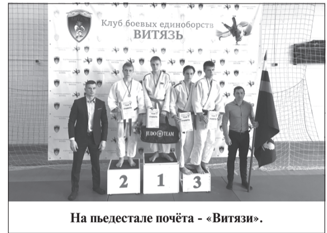
На пьедестале почёта - «Витязи».