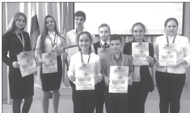
По итогам конференции 8 участников из нашего района стали победителями.

Делегация Приволжского района (школ №1 и №7) стала участником XXIV областной научно-исследовательской конференции обучающихся «Молодежь изучает окружающий мир», которая состоялась в областном центре развития дополнительного образования детей.