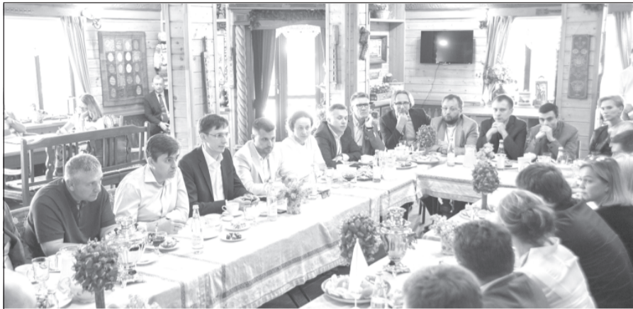
Обсуждение новой системы поддержки предпринимательства.

Губернатор Ивановской области Станислав Воскресенский провел встречу с представителями бизнес-сообщества из Москвы, Санкт-Петербурга, Владимирской, Ярославской, Ивановской и ряда других областей России. Мероприятие прошло в формате делового завтрака в рамках III Бизнес-форума на Волге.