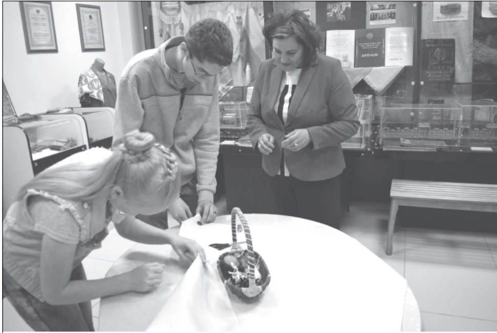
Пуговицу пришить - в ряды друзей музея вступить.