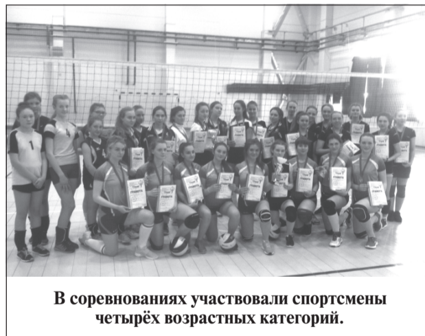
В соревнованиях участвовали спортсмены четырёх возрастных категорий.