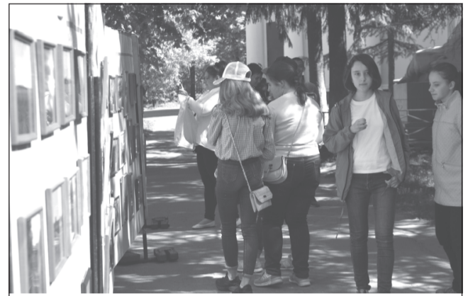
Фотовыставка - впервые под открытым небом.