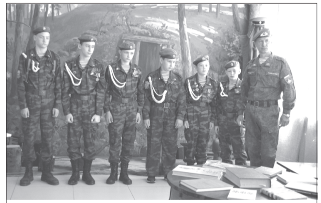
«Волонтёры Победы» готовы передать музею военные артефакты.

русском народном сознании и фольклоре. Так почему бы им не отвести роль связующего звена между человеком и музеем? Пришил пуговицу к музейному полотну — считай, что оставил в стенах музея частичку своей души. А если при этом ещё и загадал желание, то верь, что будет тебе сопутствовать успех, любовь и удача! А ещё можно по количеству пуговиц судить о количестве друзей музея... Так что, мал предмет, да удал!