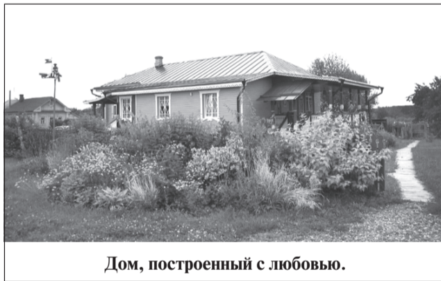
Дом, построенный с любовью.

В Ивановской области проводится конкурс-смотр на звание лучшей деревни. Любой житель региона может принять в нем участие. Условия конкурса просты: необходимо подать заявку с информацией о деревне и фотографии населенного пункта.